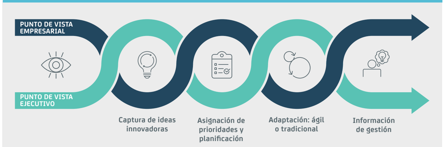
Ilustración B. Herramienta de ejecución y planificación a largo plazo

En todas las organizaciones, tanto los ejecutivos como sus subordinados deben tener la responsabilidad de alcanzar los objetivos económicos y de negocio. Esta herramienta ayuda a lograr esos propósitos, pero su eficacia depende de la capacidad de capturar con precisión los datos adecuados y de realizar un seguimiento riguroso de los costes, la financiación y las previsiones.